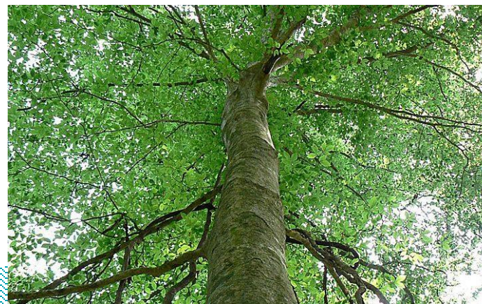
Point d'intérêt n°8 La flore (hêtre)