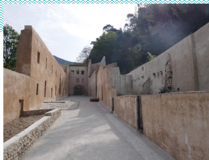
Point d'intérêt n°1 Le Paradou

Point d'intérêt n°8 : Une flore particulière avec la présence de houx, de hêtres, d'if, de charmes... et des espèces typiques de la ripisylve. On y trouve aussi une faune remarquable : Le Muscardin doré, le Cincle plongeur, le Chevreuil, l'Aigle de Bonelli, la couleuvre vipérine... A noter aussi, la présence d' Hildenbrandia rivularis , une algue rouge qui se développe à proximité de la source. Elle indique que l'eau est de très bonne qualité, car celle-ci ne supporte pas la pollution.